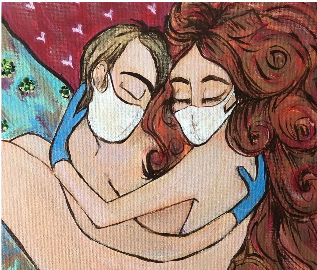
„Drž mě“ (2020), Cheryl L. Zemke

Vážení občané Informace ze 17. zasedání zastupitelstva obce Altán pro DPS Označení popelnice známkou Splatnost poplatku za odpady